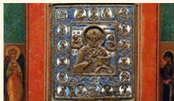
• Ikonmúzeum a Pálos Sziklatemplomban

De a Hit szeretet: Istent követ az Egyben, Hogy ember lehess.