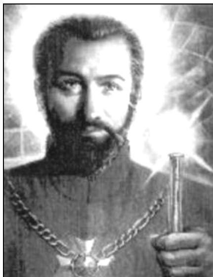
St. Germain, az alkímia mestere

Hessei Karl herceg szerint St. Germain gyermekkorában a Medici családban nevelkedett, és a család avatta be a „rózsakeresztes” és rejtett tudományokba.