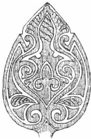
LEGYEZŐPÁLMÁS DÍSZ BÁCSKERESZTÚRI HONFOGLALÓ LOVAS SÍRJÁBÓL