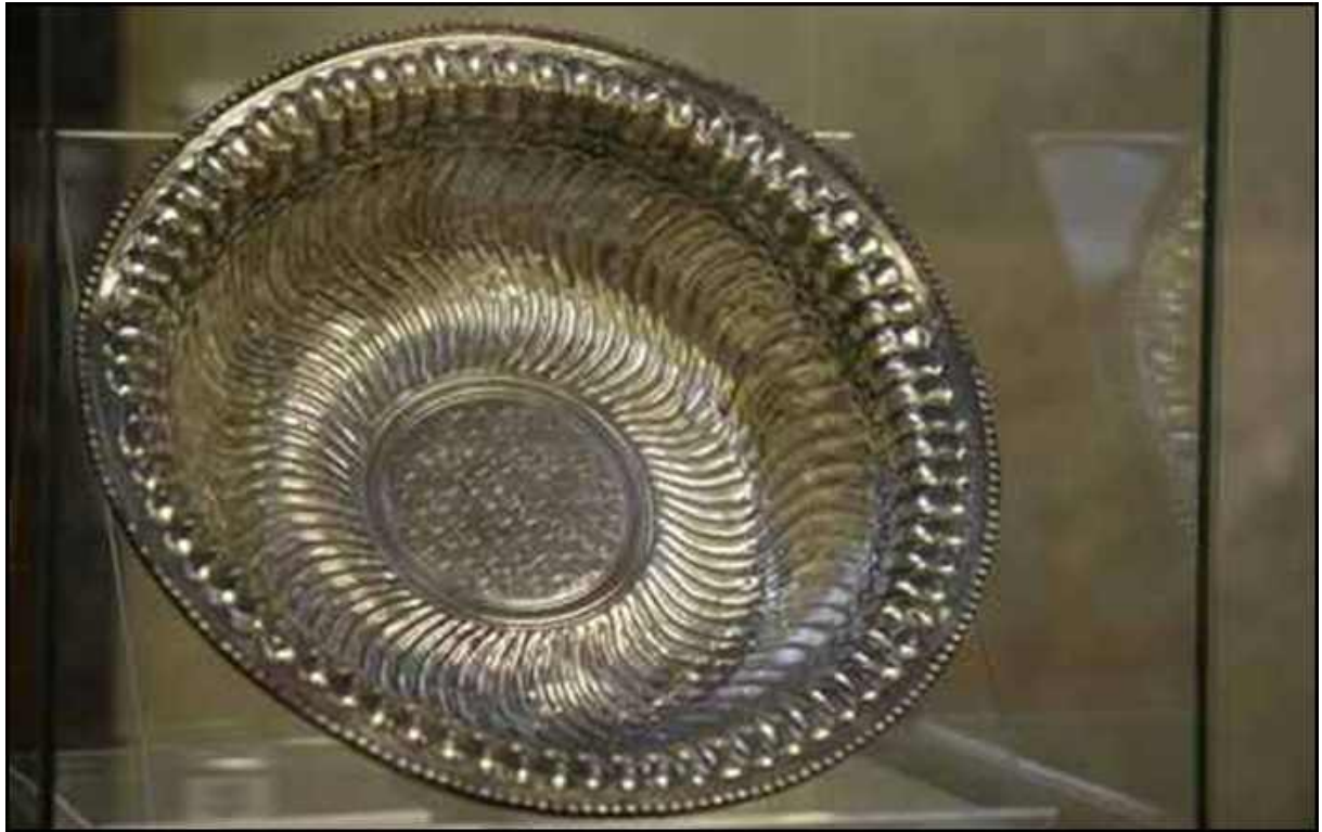
2. számú ábra A Seuso-kincs

„MA SIKERÜLT AZ, AMIT MINDIG IS AKARTUNK, VISSZATÉRT AZ A KINCS, AMELY MINDIG IS MIÉNK VOLT, ÉS AMIRŐL SOHASEM, A LEGRÖVIDEBB IDŐRE SEM MONDTUNK LE.....HA EGY ORSZÁGNAK VAN EREJE ÉS TEKINTÉLYE, AKKOR KÉPES VISSZASZEREZNI AZT, AMI AZ ÖVÉ.”