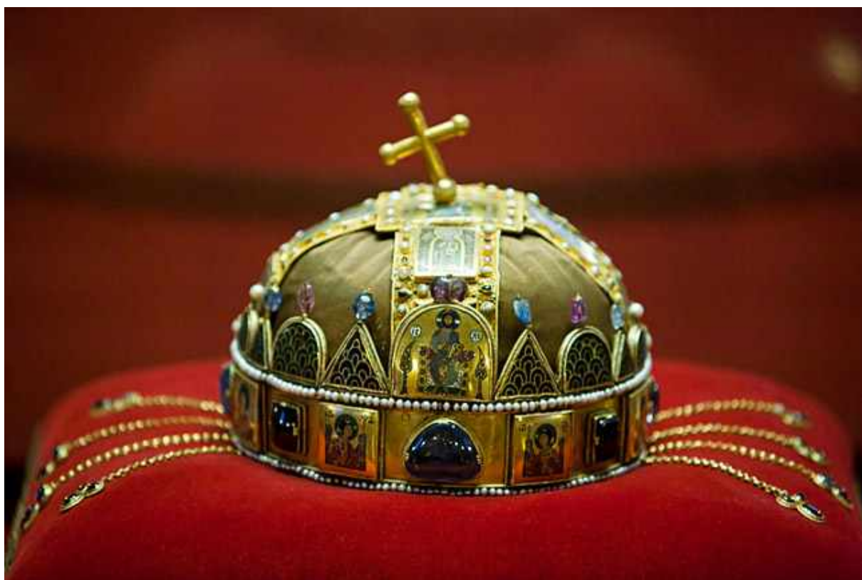
1. sz. ábra. A magyarság szeme fénye, amely megdöbbenően hasonlóan tért haza a ma visszaérkezett ezüst kincsekhez. Hogy legyen hitünk.