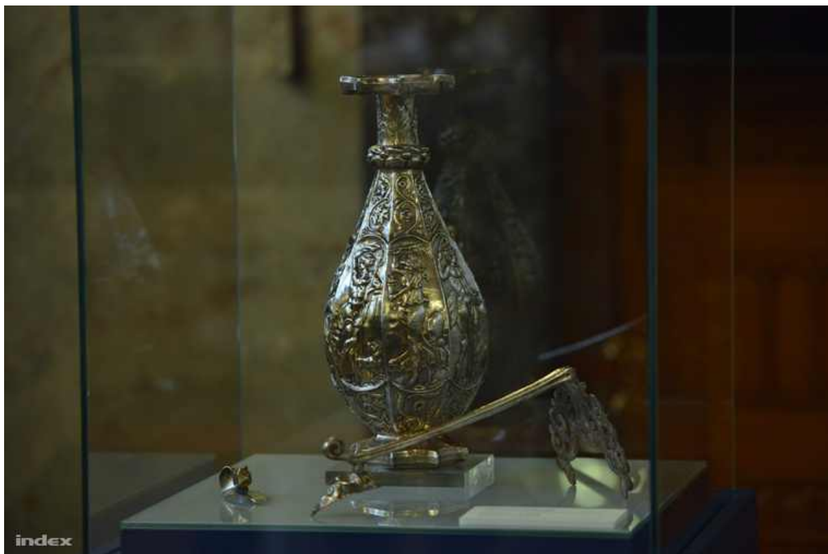
3. számú ábra A Seuso-kincs

Bármí történnék is, hitünk meg ne inogjon, mert velünk az Isten. A győzelem gyors, és határozott lesz, ellenállhatatlanul lehengerlő. Imádkozunk a békéért, mert a gonosznak csak egy választása marad: a háború. Háború pedig csak a háborodott emberek agyában fogan.