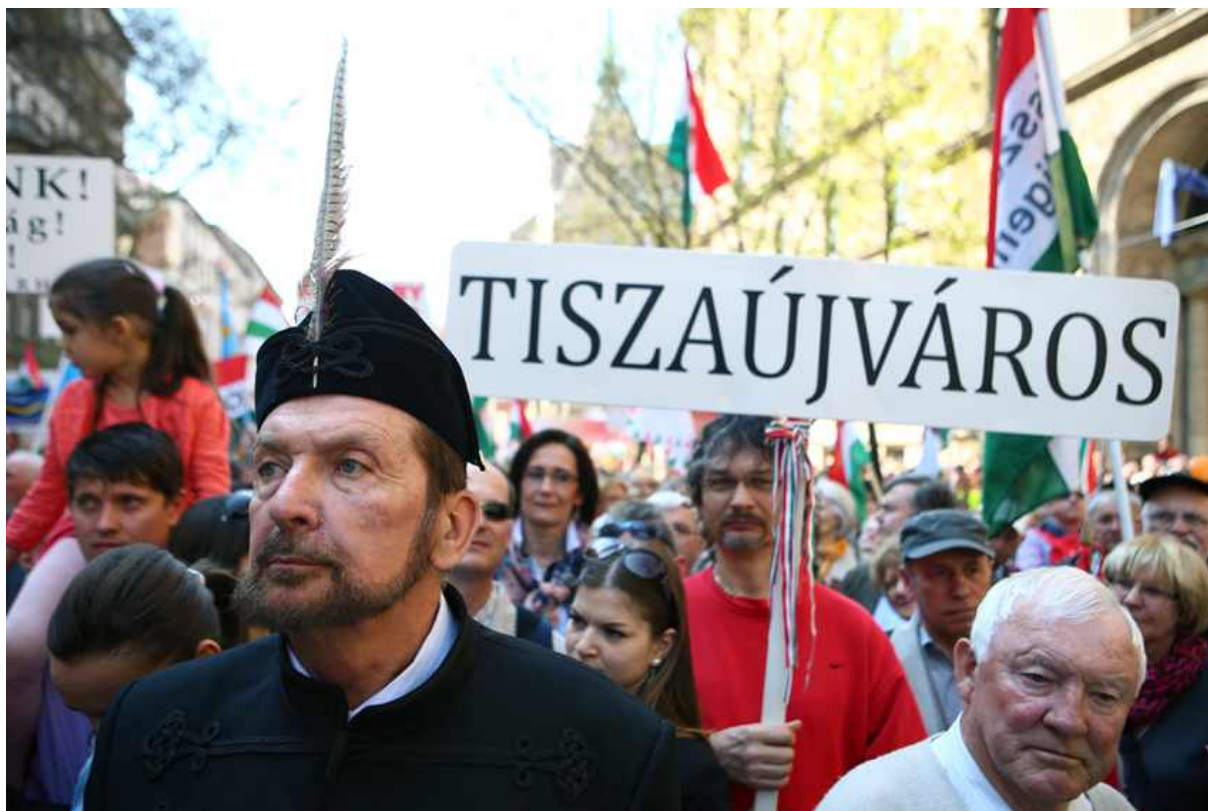
4. számú ábra Derék honfitársaink nemzeti zászlókkal (2014-03-29)

Bármí történnék is, hitünk meg ne inogjon, mert velünk az Isten. A győzelem gyors, és határozott lesz, ellenállhatatlanul lehengerlő. Imádkozunk a békéért, mert a gonosznak csak egy választása marad: a háború. Háború pedig csak a háborodott emberek agyában fogan.