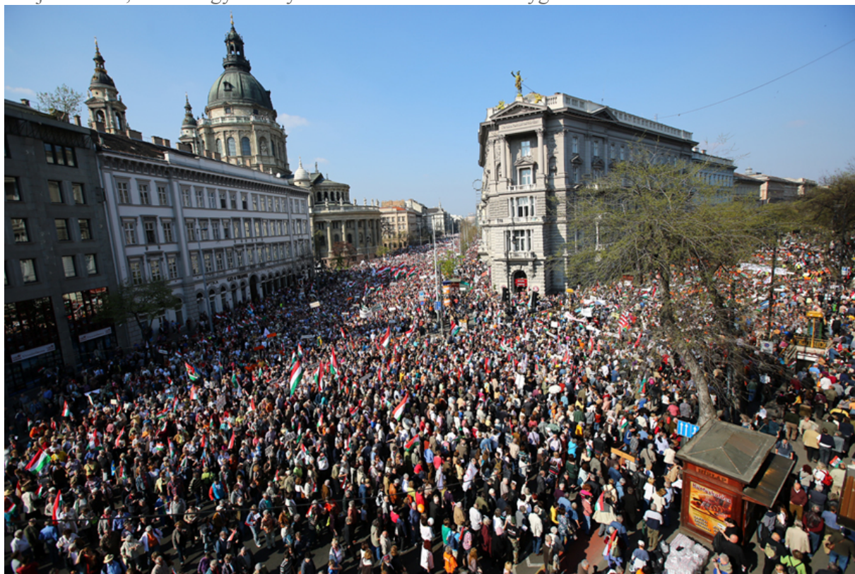
6. számú ábra (2014-03-29)

Nem véletlen Isztár goM/Mag-ok - Isztár magjai/gyermekai ők mint ahogyan ez a pilisi Esztergom/Isztárgam nevében is ott van. A magyarok tehát isztergami "oroszlánként" hatnak a Halak után immár beköszöntő Vízöntő korszakban. Közismert hogy a Vízöntő ben az Oroszlán HAT - mint ahogyan anno az Oroszlánban meg a Vízöntő hatott. Nem véletlenek a régi és új oroszlán, natúr vagy szárnyas szfinx-ábrázolások bolygószerte.