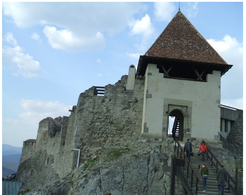
A visegrádi vár falai ma