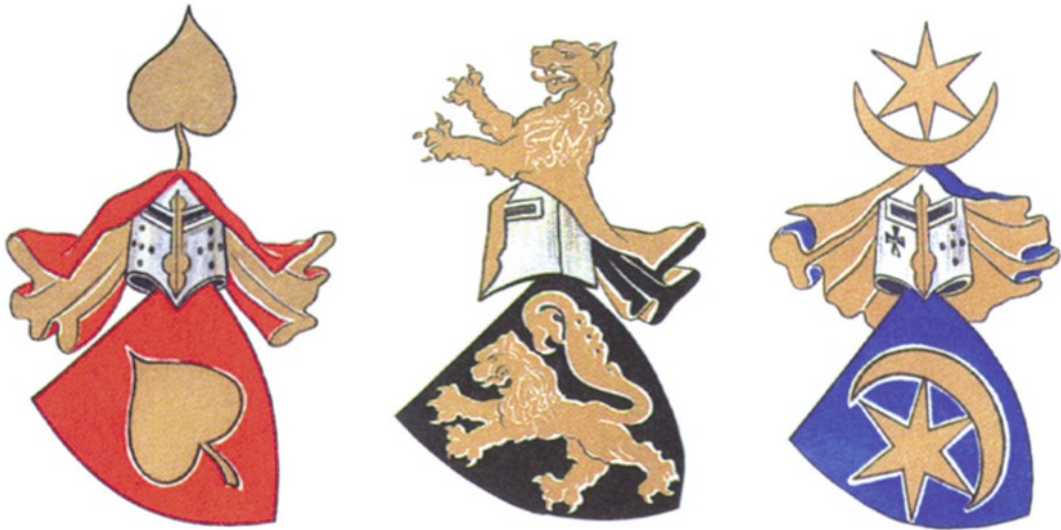
A Héder család címere, a Rátót nemzetség címere és a Hont-Pázmány család címere

Hagyományosan az Anjou királynak tulajdonítják a banderiális hadszervezet kialakítását. Azt azonban tudni kell, hogy ennek elemei már az Árpád-korban is adottak voltak. A „banderiális” azaz „zászlós” hadsereget csak a tehetős főurak, egyházi vezetők tudtak kiállítani, akik aztán saját címeres családi zászlójuk alatt vezethették csatába katonáikat. Egy főúri zászlóalj 50 nehézpáncélosból állt. Egy-egy nehézpáncélos mellett általában kilenc kiegészítőre volt szükség, ebből eredően összesen 500 emberből állt egy bandérium.