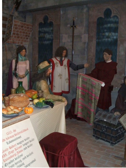
Az 1335. évi visegrádi királytalálkozó viaszfigurái a visegrádi várban. Fellelhetők az udvari zenészek és a portékáikat kínáló kereskedők

A királytalálkozóval kapcsolatban a közvetlen következmények megemlézése is fontos. A cseh király elfoglalta Ausztria északi területeit, Károly király pedig visszafoglalta a Muraközt, a nyugati területekről pedig kiűzte a Kőszegi családot. Az Anjouk trónigénye a lengyel trónra – bár összefüggött a visegrádi találkozóval – valójában csak 1339-ben lépett életbe. Ennek fejében viszont a magyar királynak segítenie kellett sógorát a Német Lovagrend ellen.