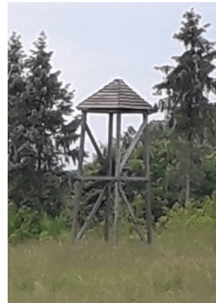
Az abaújbáryi földvár távlati képe és a bejárat az Árpádok címerével. A földvár fa szerkezetének rekonstrukciója