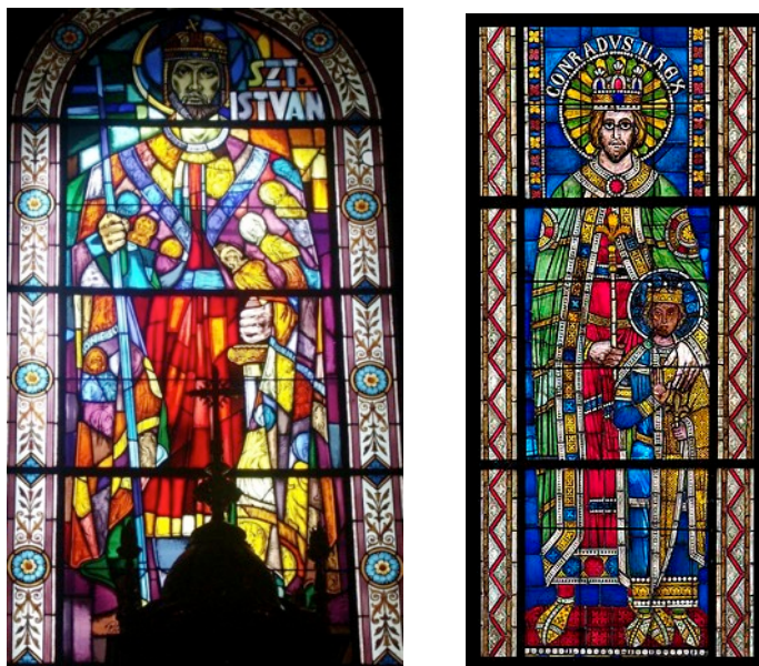
Szent István és II. Konrád császár ólomüveg képe