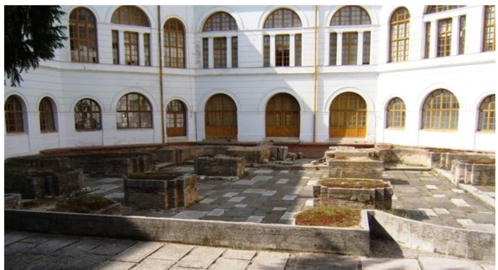
A szekszárdi bencés apátság alapítója I. Béla, akinek szobra a város központjában található. A bencés apátság alapjai a megyeháza udvarán