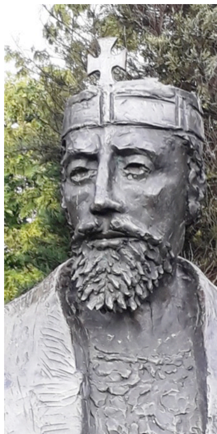
Aba Sámuel egész alakos ülő szobra Encs központi parkjában

A mai határ mentén – ahonnan már Kassát is látni – fekszik Abaujvár . A ma mindössze 250 lelket számláló kis falu Aba Sámuel idején népes város volt, s fontos szerepet töltött be, mint szállásközpont a kereskedelem, az egyházi és katonai szervezés terén. A még jórészt feltáratlan abaujvári földvár méretei arra engednek következtetni, hogy itt valaha pezsgő élet zajlott.