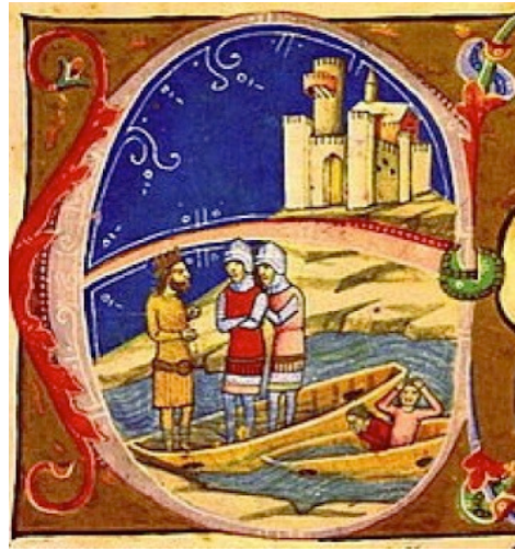
A korona és kard történetének, valamint Búvár Kund hőstétének ábrázolása a Képes krónikában

A német támadások azonban tovább folytatódtak. Nem nyugodtak bele, hogy András halála után nem a német-római császársághoz hű Salamon, hanem András testvéröccse, Béla került az Árpádok trónjára. I. Béla (1060-1063) és a császár ellentéte azonnal kiújult, hiszen Henrik hűbéresét, Salamont szeretne trónra juttatni. Az idegenek szövetségesei a fegyveres harcok mellett a merénylettől sem riadtak vissza. Így esett meg, hogy 1063-ban Dömösön, ahol Béla király tartózkodott, az uralkodóra ráomlott a nehéz tölgyfából készült trón. (Bélát vitézsége, hadvezéri tehetsége okán Bajnok Béla néven is emleget az utókor. Az 1051. és 1052. évi német támadásokat is Béla herceg vezetésével verték vissza.)