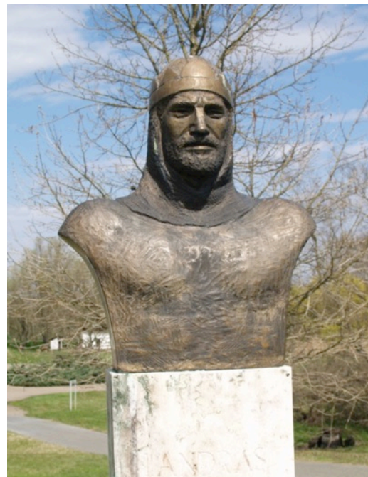
András király és felesége, a kijevei Anasztázia szobra Tihanyban I. András király mellszobra Ópusztaszeren

A német támadások tovább folytatódtak. 1051 őszén III. Henrik csapatai Fehérvárig nyomultak előre. A magyarok a felperzselt föld taktikáját követve kitértek a német támadások elől, ezzel is fárasztva őket. A visszavonuló, éhező, fáradt betolakodókat a magyar király csapatai Béla herceg vezetésével a Vértes-hegységben megtámadták és megsemmisítő vereséget mértek rájuk. III. Henrik nem nyugodott bele a vereségbe, 1052 nyarán ostrom alá vette Pozsony várát. A Dunán felsorakozó hajókat egy Zotmund nevű bűvár és néhány társa az éjszaka leple alatt megfúrta. A hajók hajnalra elsüllyedtek. (A Bűvár Kund név Vörösmarty Mihály költeménye alapján terjedt el.) A német-római császár szégyenszemre visszavonulót rendelt el, hiszen ismét vereséget szenvedett. A németek azt azonban elérték, hogy Magyarországot még erősebb szálakkal magukhoz kössék. 1058-ban az új császár, IV. Henrik (III. Henrik fia) Katolikus Andrással békét kötött. Ennek egyik megállapodása alapján Henrik testvérét, Judit hercegnőt eljegyezték az 1057-ben társ királlyá koronázott gyermek Salamonnal, András király fiával. (Korona és kard története.)