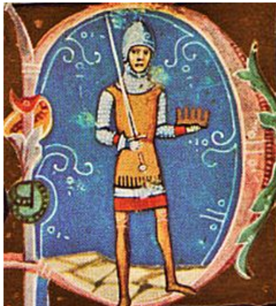
Orseolo Péter, aki kétszer is elfoglalta a magyar trónt (Képes krónika)

A szkíta vérű magyarok nem tudtak belenyugodni, hogy idegen uralkodjon a magyar trónon. Az 1046-ban Vata békési ispán vezette lázadás sikeres volt, elűzték Pétert a trónról. A király a harcok során életét vesztette. (A sok áldozatot követelő trónviszályban Gellért, Budli és Besztrik püspökök is mártírhalált