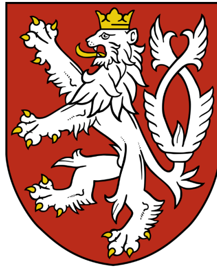
A lengyel és a cseh címer Vencel király idején