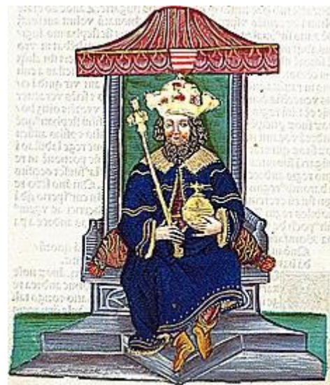
Cseh II. Vencel király mellszobra. Középen fia, Vencel magyar király címere. Vencel magyar király ábrázolása a Thuróczi krónikában

Vencel korábbi támogatói, elsősorban a magyar főpapok átpártoltak Caroberto mellé. Talán mert a pápa is őt támogatta, talán az újabb és nagyobb birtokadományok reményében, talán a nemzetközi erőviszonyok változása miatt. A Habsburgok veszélyeztetve látták a dinasztiájuk érvényesülését, ezért szembe szálltak a Premysl dinasztia utolsó, még élő tagjával. A mindössze 16 éves Vencel idegeit felőrölte az állandó hatalmi harc. Vencel élete utolsó hónapjaiban – mintha érezte volna végzetét –, pazarló, kicsapongó életmódot folytatott. Számolatlanul osztogatta a királyi birtokokat, címeket, nem törődve az országgal, nem törődve a dinasztia jövőjével. Elhagyta jegyesét, az utolsó Árpád-házi leszármazottat, Erzsébetet. A cseh főurak végül rávették az ifjút, hogy házasodjon meg, aki végül feleségül vette Piast Viola hercegnőt. A házasságból nem született gyermek.