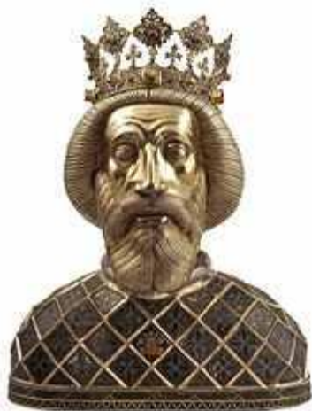
6. számú ábra. Szent László hermája

S a „ Miatyánk ” Szent László t a maga helyén is telibe találja. Ő ugyanis az Ikrek világhónap középső Mérleg dekanátusát képviselő magyar királyunk. S a Turul nemzetség fényes csillagai között is legfényesebben ragyogó csillagunkként a Miatyánkban ott van, ahol a „... mennyei kenyérünket add meg nekünk ma... ” szakasz, az „ Ember tragédiájában ” a Mennycsászár . A Szent Koronán pedig ezt a hozzárendelt dekanátust a két gyógyító testvér páros, Kozma és Damján képviseli, attól függően, hogy melyik oldalról olvassuk le a Koronát. S hol is kapnánk mennyei kenyérünket máshonnan, mint a