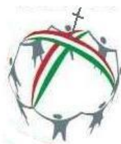
Csaba királyfi csillagösvénye

Nagyjából ezek a legegyszerűbb számtani műveleteket, összeadást és kiadást feltételező feladatok.