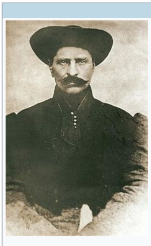
Rózsa Sándor fényképe

1813.július 10. Rösztke -1878. november 22. Szamosújvár